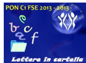
comunicazione nella madrelingua