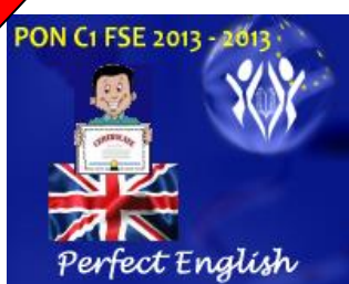
comunicazione nella lingue straniere

Azione di disseminazione e di pubblicizzazione del Piano Integrato di Interventi PON/FSE “Competenze per lo sviluppo” – Anno scolastico 2013/2014.